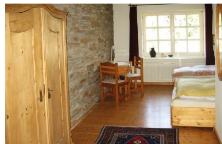
Beispiel Zimmer ...

Einzel- ca. 196.- €, Doppel- ca. 178.- € pro Person/ Aufenthalt (je nach Anzahl der Teilnehmeranzahl – Seminarraum wird anteilig umgelegt)